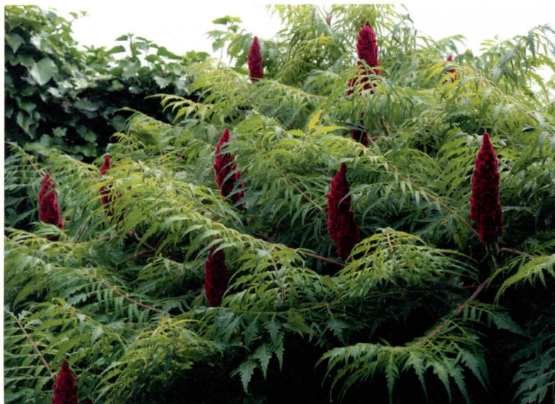
Rhus heeft bloem pluimen die lang in de winter blijven opvallen.