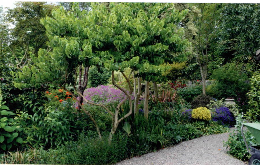
Heptacodium miconioides kenmerkt zich door de late zomerbloei.

Anno Kuindersma van Anno 2000 kiest voor Heptacodium miconioides . „Ik ontdekte de plant bij de kwekerij van Albert Leemreize waar een volgroeid exemplaar staat.“ Groot voordeel vindt hij dat Heptacodium ook als meerstammige solitair is te gebruiken. De sierwaarden zijn volgens hem divers. „Door de late zomerbloei, iets dat bij weinig andere bomen voorkomt, is Heptacodium laat in het seizoen een echte blikvanger. Extra is dat bijen graag de bloemen bezoeken.“ Tijdens de wintermaanden ziet hij sierwaarde in de afbladderende bast. „Dat komt vooral bij een opengesnoeide kroon mooi tot zijn recht.“ Kuindersma plaatst Heptacodium graag als meerstammige struik tussen vaste planten. Dat zorgt volgens hem voor jaarrond body. Over de verkrijgbaarheid is hij tevreden. „Grote meerstammige exemplaren zijn soms prijzig maar zorgen wel voor het versnellen van het eindbeeld.“