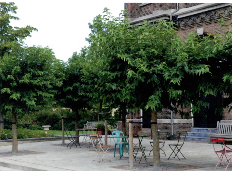
Morus alba geeft roze framboosachtige schijnvruchten.