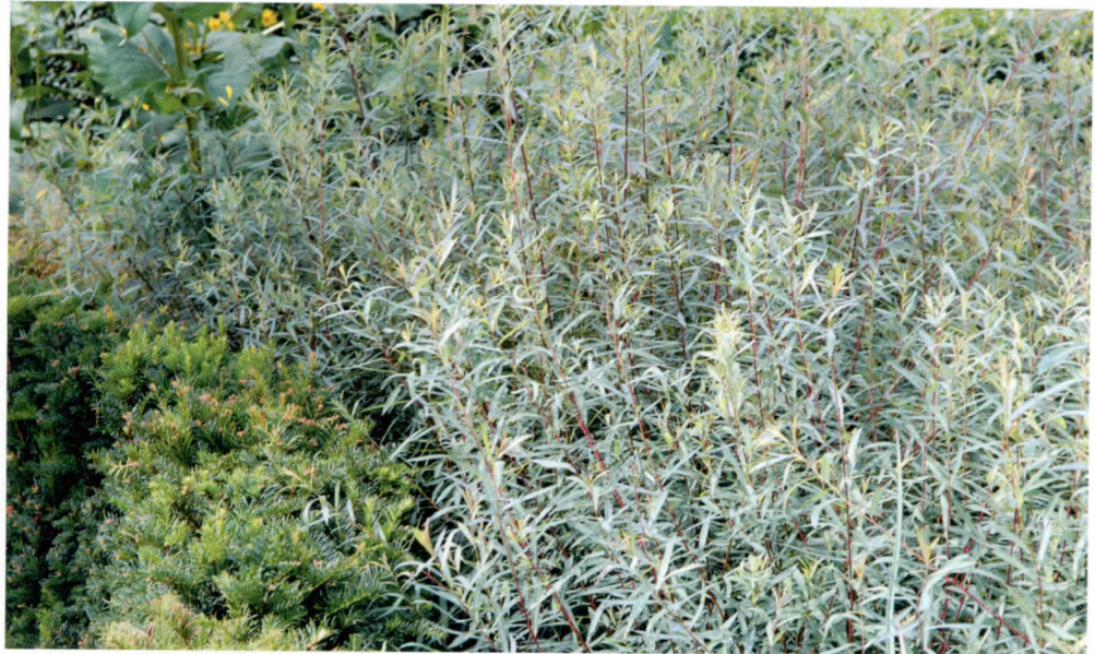
Salix elaeagnos 'Angustifolia' heeft roodbruine twijgen.

Tuinarchitect Arjan Boekel noemt Salix elaeagnos 'Angustifolia', bekender onder de oude naam S. rosmarinifolia . „Een onderschatte heester met smal grijsgroen blad aan dunne buigzame takken tot circa 1 meter hoogte.“ Boekel vindt deze struikwilg een prachtige bladplant die prima te combineren is met andere heesters – „bijvoorbeeld Hydrangea quercifolia of Cotinus 'Grace' – en vaste planten. „De ruige pollen met grijs blad brengen alle aandachttrekkers eromheen tot rust. Een extraatje zijn de subtiel mooie roodbruine twijgen.“ Tussen vaste planten aangeplant, knipt hij de heester aan het einde van de winter vrij ver terug zodat het nieuwe loof samen met de vaste planten opgroeit. Over de verkrijgbaarheid zegt hij: „Ik koop ze gewoon klein in een C2. Zo'n plant groeit in een seizoen uit tot een mooie pol. In grotere maten zie ik ze zelden.“