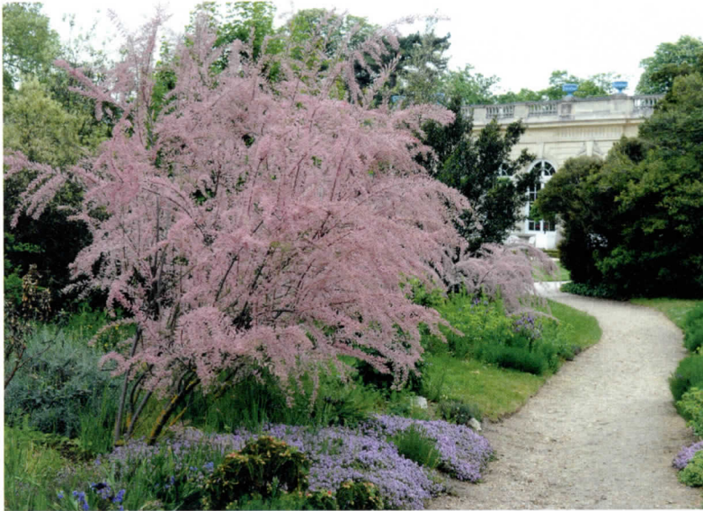
Tamarix tetrandra doet exotisch aan.